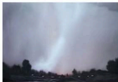
"Förbarma dig" av Helen Eriksdotter. I denna målningen syns, precis som i "Hembygd", den svenska naturen och vemodet.

- 2016 gjorde jag illa min rygg, så jag kunde inte längre sitta och spela i en symfoniorkester, vilket var mitt yrke då. Och om man är kreativ som jag så kan man inte låta bli att testa olika saker. År 2019 köpte jag mina första färger. Jag älskade oljemåleri och ville lära mig det, men det var så dyrt så jag köpte akvarell istället. Det är väldigt knepigt att måla med akvarell, men jag tyckte att det var så kul att försöka.